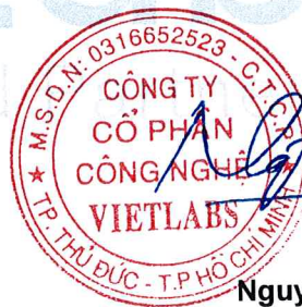
Nguyễn Quốc Toàn

Kết quả chỉ có giá trị trên mẫu thử; (1) thông tin do khách hàng cung cấp; Thời gian lưu mẫu 07 ngày kể từ ngày trả kết quả/Test results are valid only on tested sample; (1) information provided by clients; Time- limit of storage: 7 days from the reporting date.